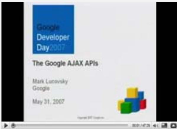
The Google AJAX APIs [eng]