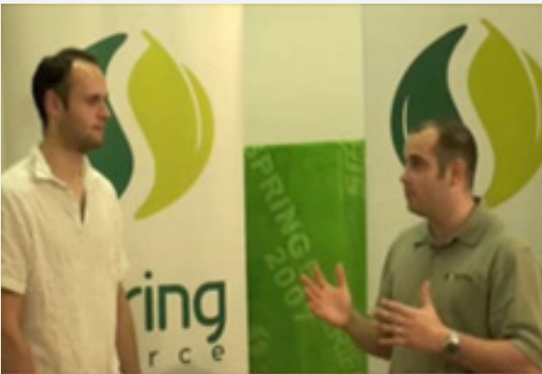
• Spring - Faq [eng]