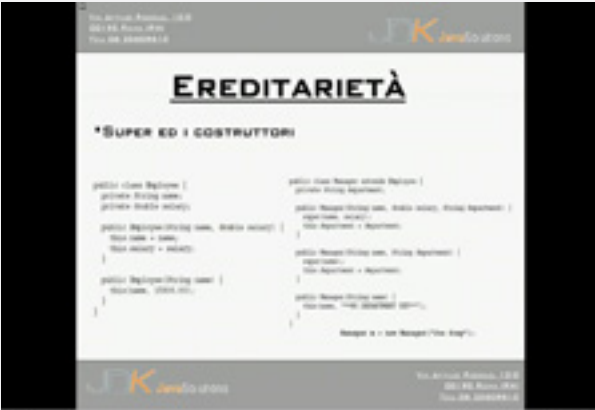
• Java J2EE: Ereditarietà